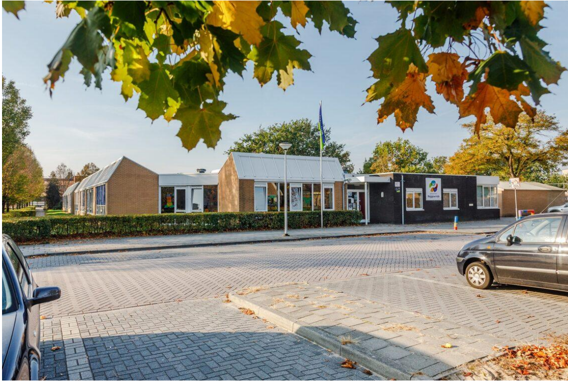
Nijverdal (110 leerlingen)