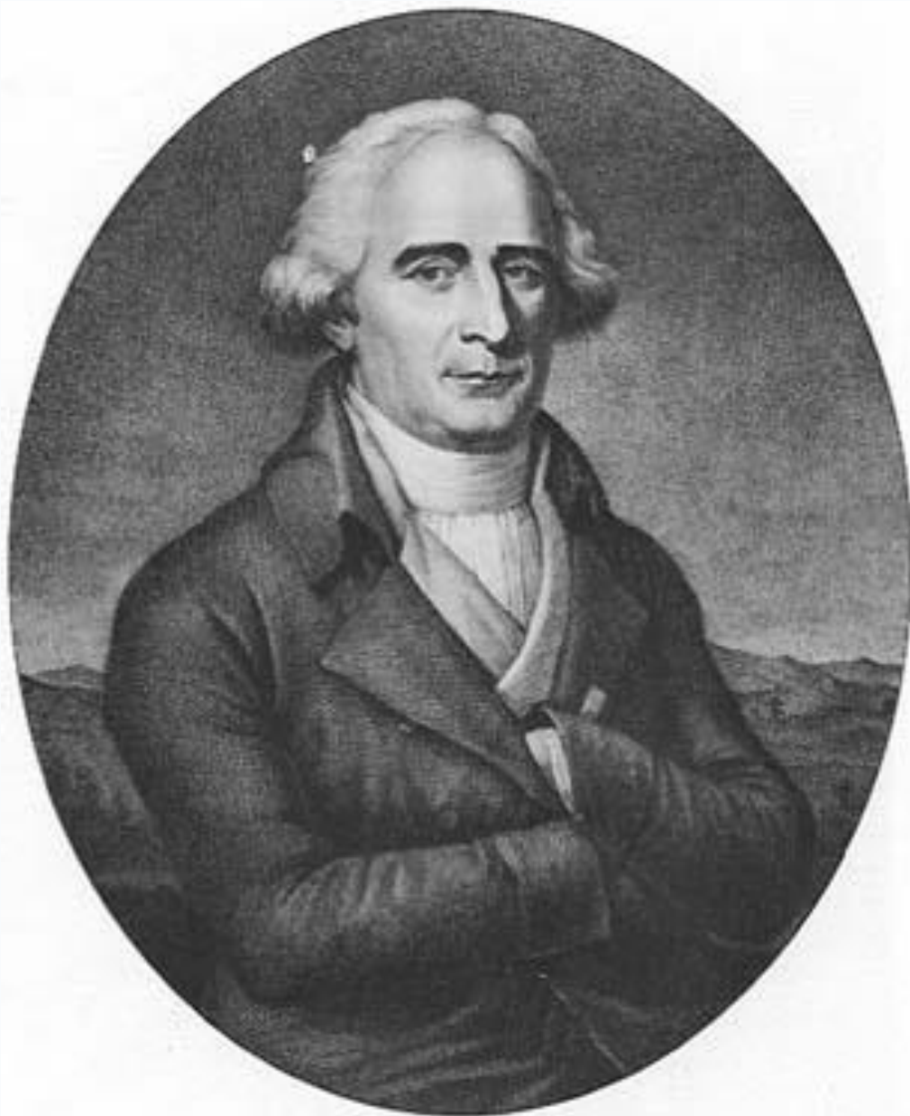
Joseph Michel Montgolfier