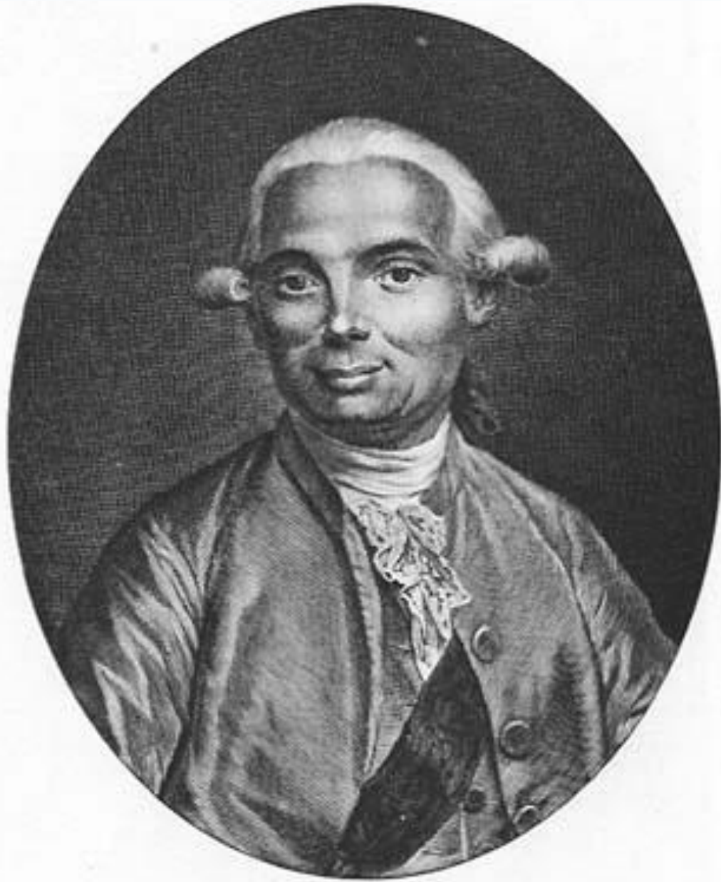
Jacques Etienne Montgolfier