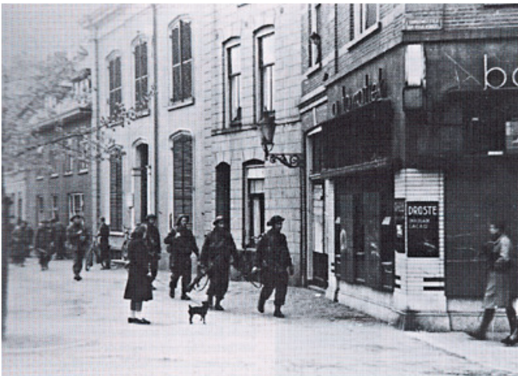
Vanuit verschillende richtingen trokken Op 14 april 1945 de Canadezen de Zwolse binnenstad binnen. Deze bevrijders komen uit de Van Karnebeekstraat en lopen hier de Van Roijensingelop. Op deze hoek zit nu snackbar Norp.

Ik ging alleen de stad in en een uur later was de hele brigade daar om het feest mee te maken.